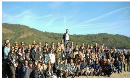
AB Cova da Beira, 2024