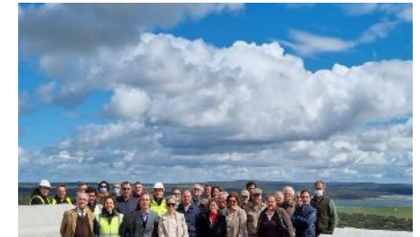
AB Minutos, 2022