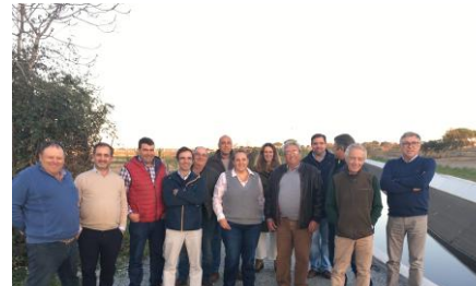
AB Vale do Sado, 2021