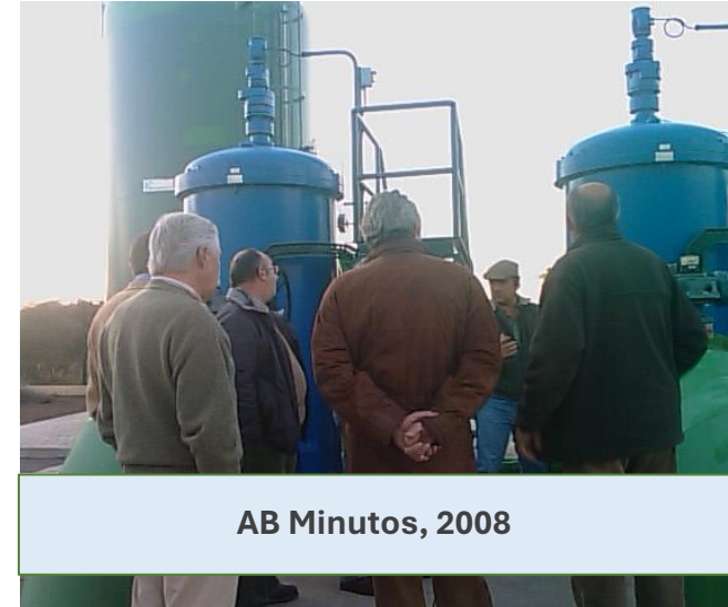
AB Minutos, 2008