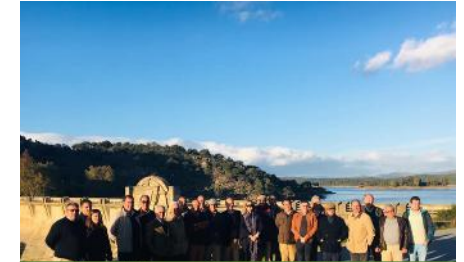
AB Idanha, 2018