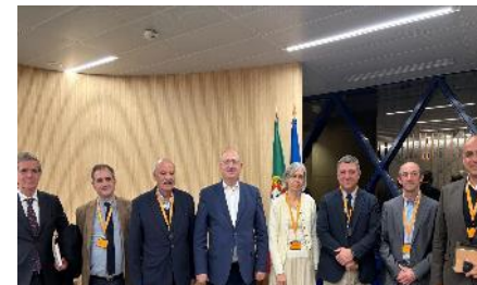
Ministério da Agricultura, 2025