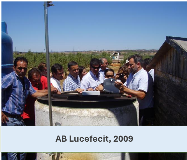
AB Lucefecit, 2009