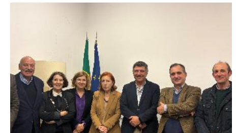
Ministério do Ambiente, 2025