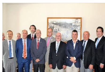
Irrigants d'Europe, 2017