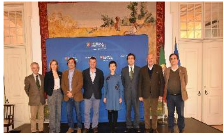
Ministério da Agricultura, 2020