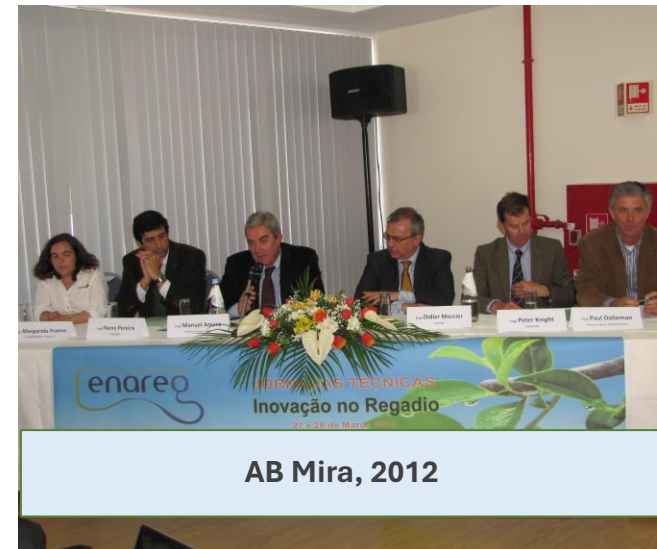
AB Mira, 2012