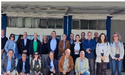
AB Roxo, 2023