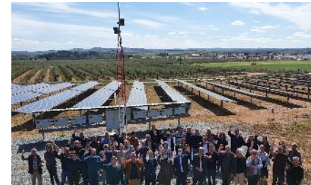
AB Roxo, 2022