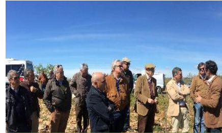
Alfândega da Fé, 2016