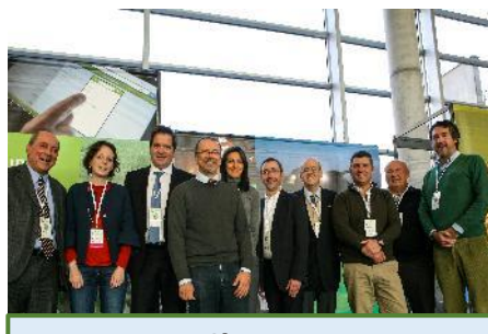
Irrigants d'Europe, 2018