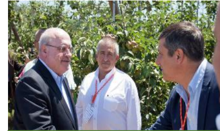
AB Cela, 2017