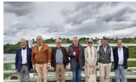
AB Macedo de Cavaleiros, 2024